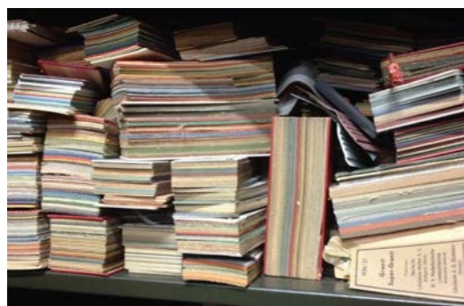
Bland de mer sentida föremålen rönte skåpet med linoleumprover från Forshagas golvfabrik stor uppskattning.

Vid visningen kunde flera spännande föremål studeras. Eller vad sägs om en kollergång för krossning av kakoböner från Franska Choklad- och Konfektfabriken? Samlingen omfattar också många andra stora och svårutställda föremål som fordon, ångmaskiner, verktygsmaskiner och tryckpressar.