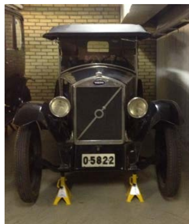
Volvo Larsson – en av Volvos allra första prototyper, tillverkad 1926. Den serietillverkade modellen fick senare smeknamnet Jacob.

Vid visningen kunde flera spännande föremål studeras. Eller vad sägs om en kollergång för krossning av kakoböner från Franska Choklad- och Konfektfabriken? Samlingen omfattar också många andra stora och svårutställda föremål som fordon, ångmaskiner, verktygsmaskiner och tryckpressar.